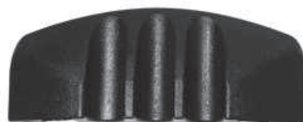
DEFENDER MINI Embout femelle