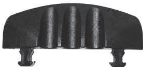
DEFENDER MINI Embout mâle